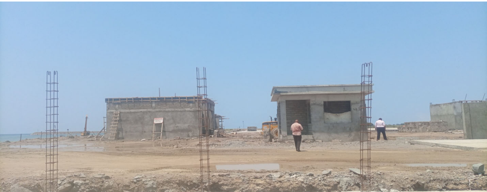
Muonekano wa mradi wa ujenzi wa Bandari ya Karema iliyopo Mkoani Katavi.

K atika kipindi cha mwezi Julai 2021 hadi mwezi juni 2022, Ofisi ya Kanda ya Magharibi imetoa jumla ya vibali 6 vya uingizaji wa bidhaa za dawa za binadamu na mifugo Nchini, Huku ikishiriki katika vikao vya pamoja baina ya Taasisi za Serikali ya Tanzania, Serikali ya Burundi na Jumuiya ya Afrika Mashariki kwa ajili ya kupitisha michoro ya ujenzi wa Kituo cha pamoja cha mpakani (One Stop Border Point, OSBP) kitakachojengwa eneo la Manyovu.