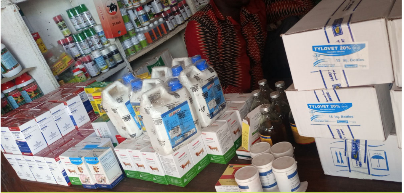
Baadhi ya dawa za kutibu mifugo zilizokamatwa na Wakaguzi wa TMDA Kanda ya Magharibi

kina mama wajawazito, kutoa huduma za matibabu ndani ya duka, kuuza vifaa tiba ambavyo ni mali ya Serikali ya Jamhuri ya Muungano wa Tanzania na dawa kutoka Kenya ambazo hazipaswi kuuzwa nchini ikiwemo dawa zinazotolewa bure na serikali kwa wagonjwa.